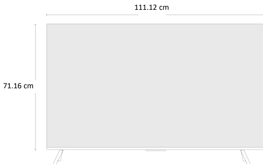
DIAGRAMA Y MEDIDAS DE INSTALACIÓN